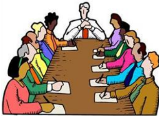
AMMINISTRATORE DEL CONDOMINIO

In caso di interventi condominiali , il condomino che opta per la cessione del credito :